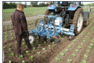
Lugerobotten bliver i første omgang fremstillet i en lille udgave, der dækker fem rækker på marken. Det er planen senere at lave en version til 15 rækker.